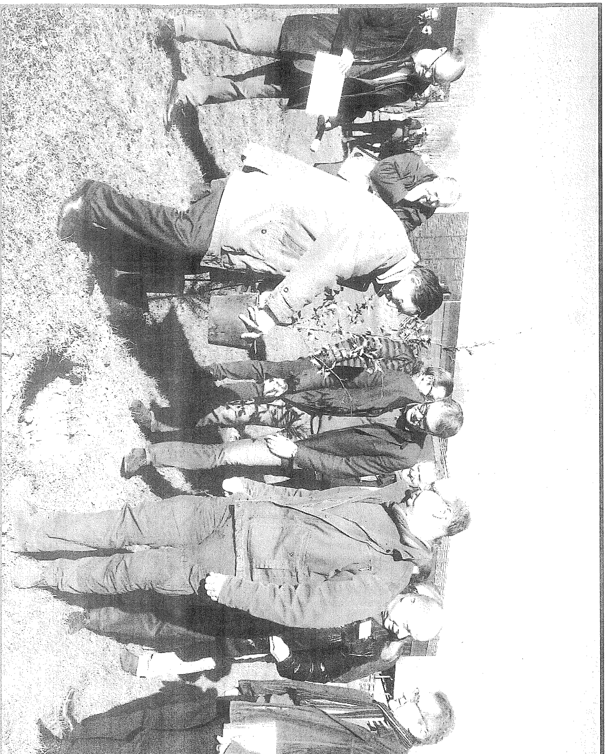
Trois essences, (hêtre, châtaignier et douglas), ont été plantées au pôle de Lanaud, le jour du lancement de ce fonds

Avec ses 33 % de taux de boisement, la forêt limousine est constituée de deux tiers de feuillus et d'un tiers de résineux. Bien que jeune, elle constitue le second secteur d'activités après l'agriculture en terme de poids économique : elle génère 30.000 emplois induits.